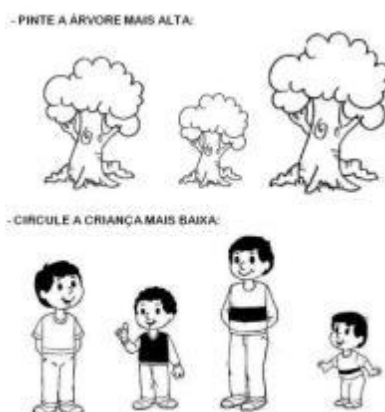
IMAGEM DA ATIVIDADE.